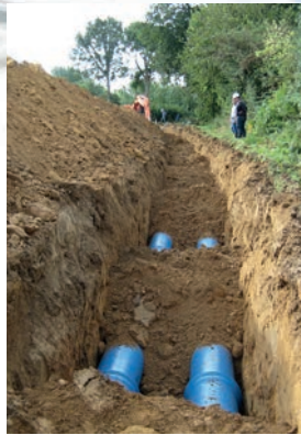
SCHÉMA ET PATRIMOINE

Ces 2 études subventionnées par l'Agence de l'Eau et le Conseil Général vont être réalisées en complémentarité par les agents du SDeau50 et le bureau d'études retenu par le bureau syndical.